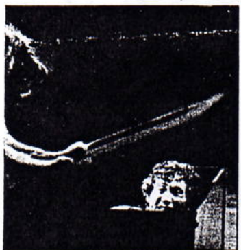
r blir Old Regnas fångad av sina hundar i