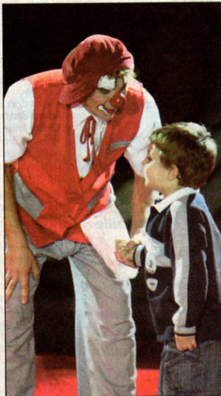
Uno dei clown del gruppo The Saly

Moira Orfei circus è uno spettacolo elegante, condotto da Giorgio Vidali, che si distingue per la musica dal vivo e le sedute sufficientemente comode. Una macchina immensa che funziona grazie a 110 persone fisse e un'altra settantina in viaggio per preparare le piazze. Il corpo di ballo del Circo di Mosca garantisce colore e precisione in ogni momento di transizione, in quegli attimi frenetici in cui si srotolano teloni, si sganciano cavi, si cambia-