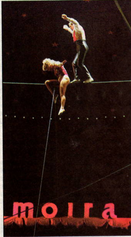
I Guerrero, duo mozzafiato di acrobati